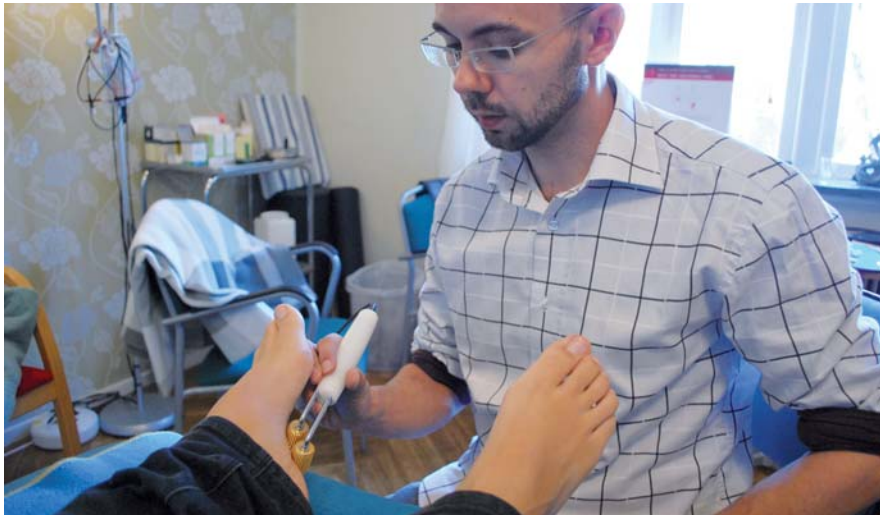
ÖMMA FÖTTER. Efter en minuts behandling är de ömma fötterna ett minne blott.