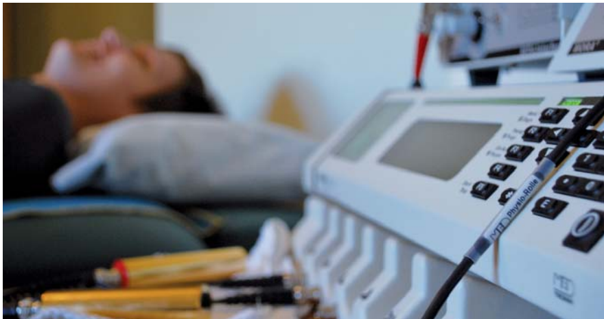
Bota allergiker. Maskinen som används kan också bota allergier. Då byts färg ut mot allergiämnen.